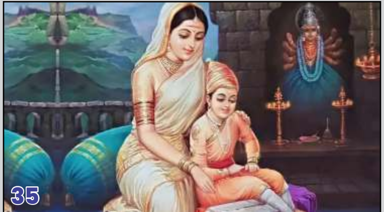
अदम्य साहस की प्रतिमूर्ति-जीजाबाई