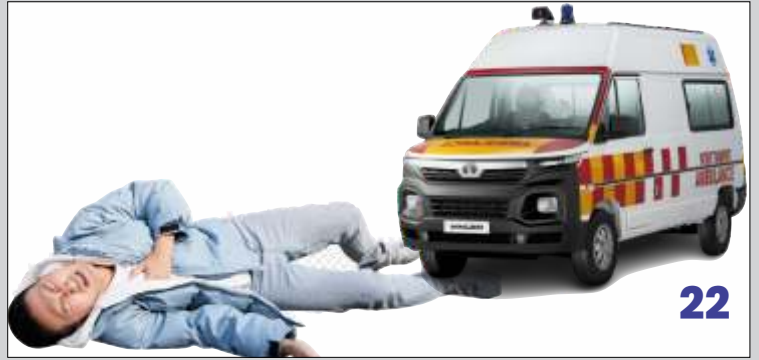
SACTEM का संकल्प अब हार्ट अटैक व ब्रेन स्ट्रोक से नहीं होगी कोई मौत