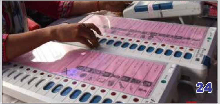
कांग्रेस करेगी करिश्मा या चलेगा मोदी मैजिक