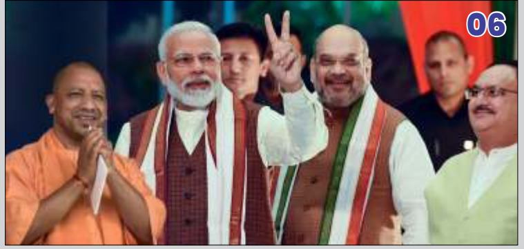
भारतीय जनता पार्टी माहौल पक्ष में, पर चुनौतियां भी कम नहीं

इस अंक में प्रकाशित सामग्री के आंशिक या पूर्ण रूप से पुनर्प्रकाशन के लिए लिखित अनुमति अनिवार्य है। लेखक के विचार व्यक्तिगत हैं। किसी भी प्रकार के विवाद के समाधान के लिए न्यायक्षेत्र लखनऊ होगा।